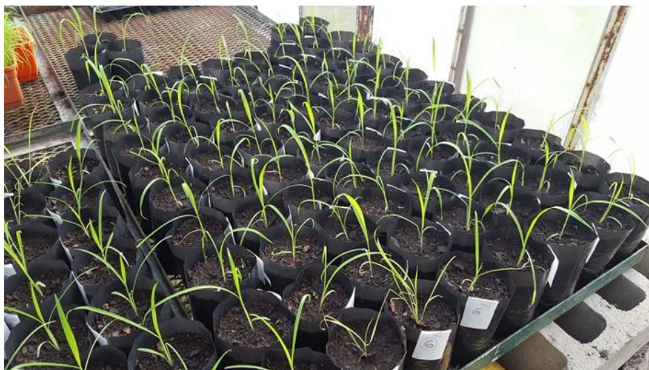
Figura 1. Plántulas de los diferentes biotipos de Echinochloa crus-galli recolectados al momento de la aplicación.